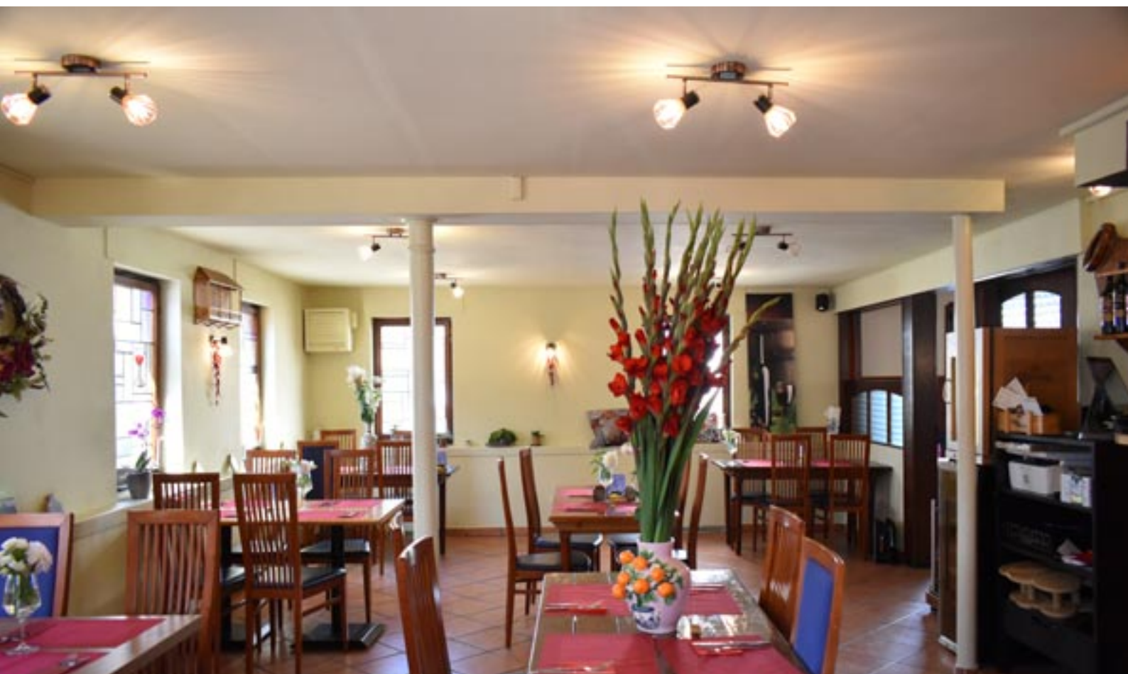
Gastraum I (Die Trennwände zwischen Gastraum I und II sind versenkbar, sodass die Sicht auf die Bühne gegeben ist).