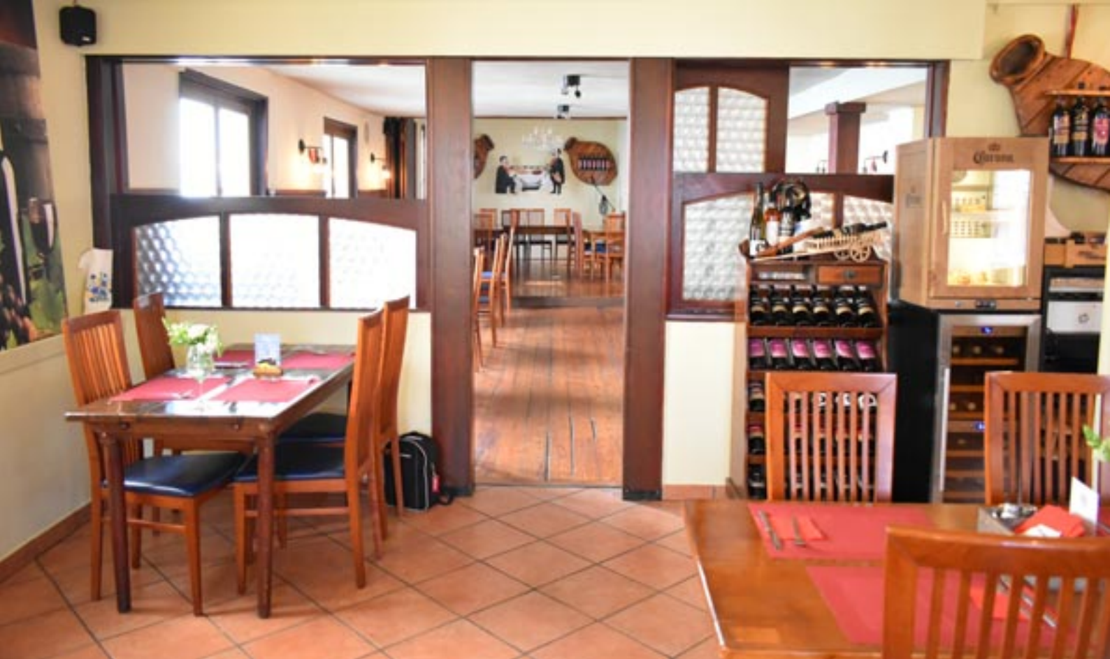
Sicht aus Gastraum I auf den Bühnen-Bereich / Gastraum II.