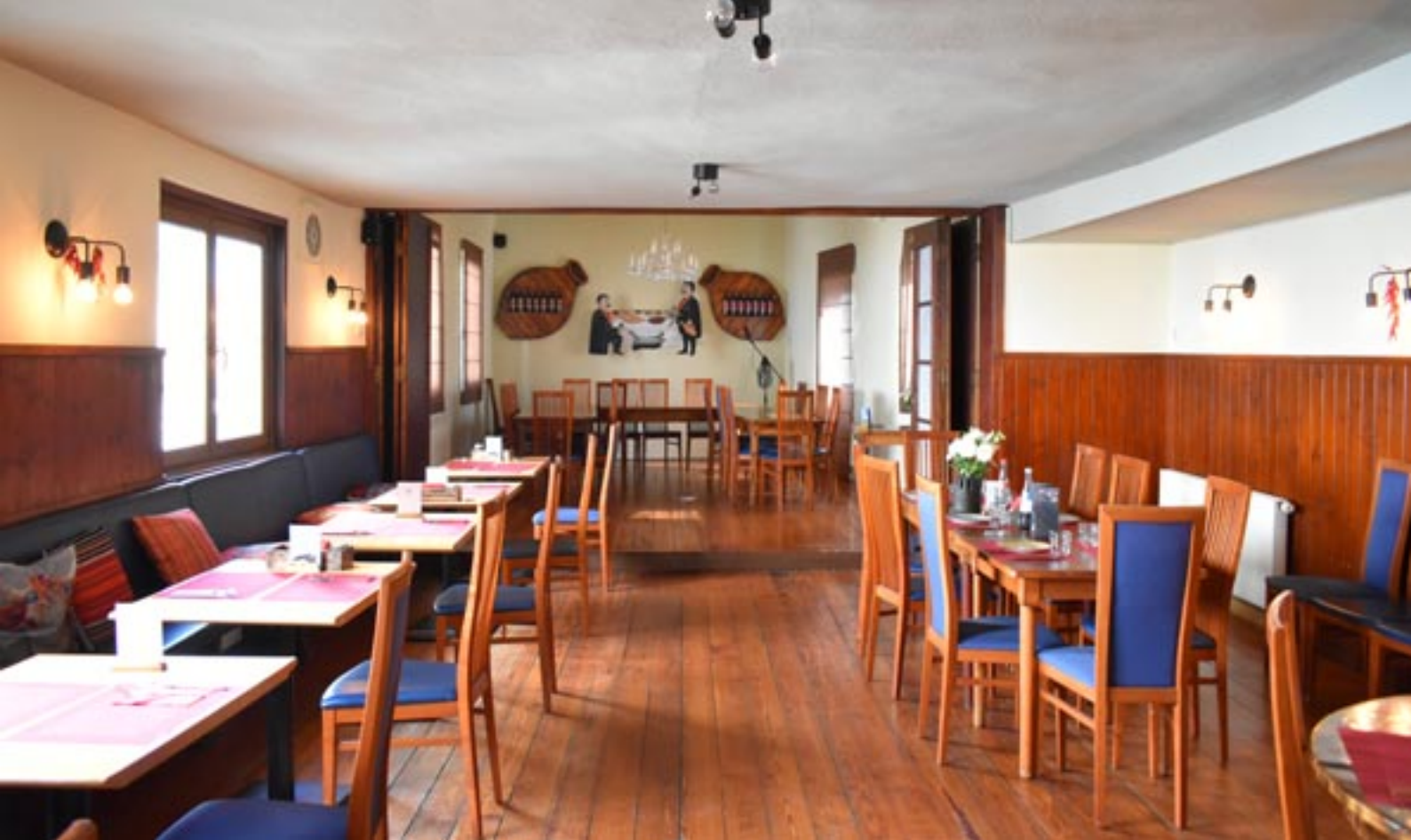
Sicht aus Gastraum II auf den Bühnen-Bereich.