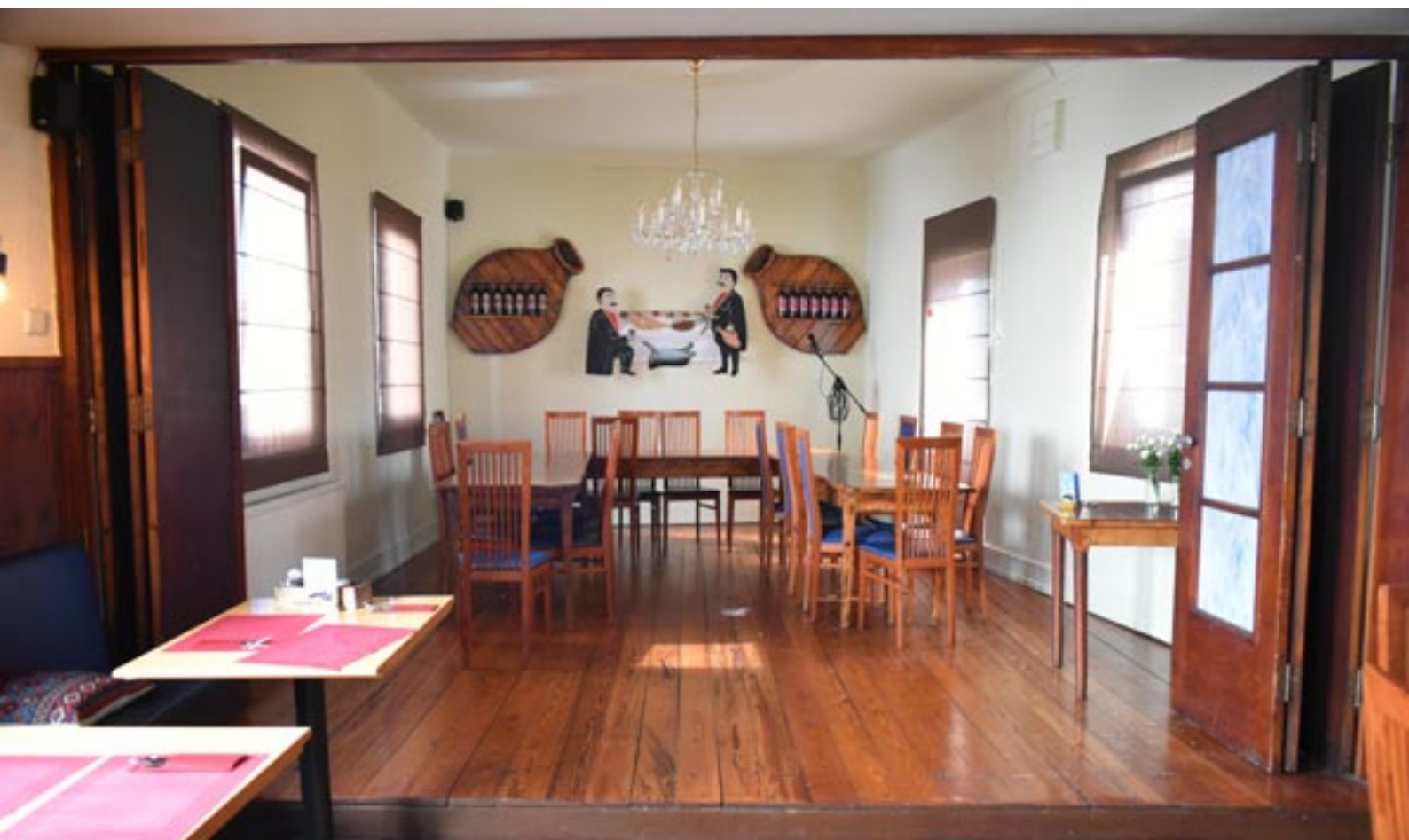
Bühnen-Bereich (Stühle und Tische werden entfernt und im Gastraum II aufgestellt).